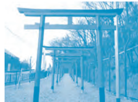
千里丘稲荷神社 朱色の鳥居が続く階段の先に社殿があります。