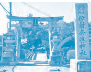
いざなぎ 伊射奈岐神社 本殿は大阪府指定有形文化財。